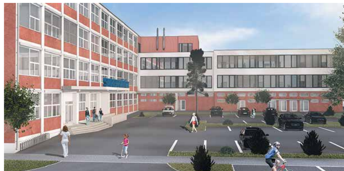
A kibővített, felújított szakrendelő látványterve – az oldalsó szárny két emelettel bővül

A Jókai úti Szakrendelő bővítése a XVI. kerület eddigi legnagyobb beruházása. Az eddig földszintes melléképületre két további szint kerül, helyet kapnak eddig hiányzó egészségügyi szolgáltatások, ide költözik az orvosi ügyelet a Benő utcából – mintegy 2,1 milliárd forintból, amiből több mint 500 milliót az önkormányzat finanszíroz.