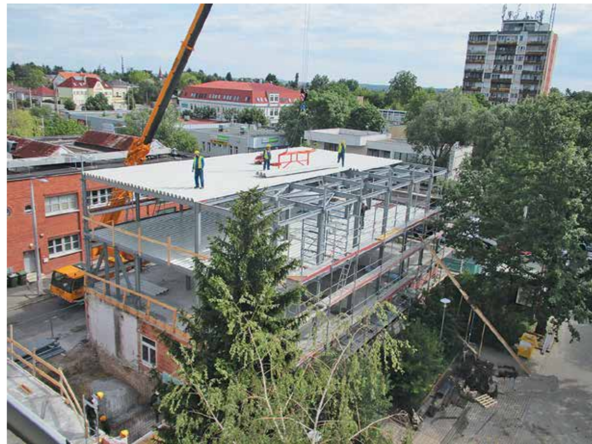
Az M2 épületszárny első és második szintjének szerelése a szakrendelő felől fényképezve

lépcsőház felől lesz megközelíthető a gyógytorna, ami igencsak terebélyesedik: három gyógytornász terem is létesül, egy az M1 részen, kettő pedig a földszinti sebészet korábbi helyén. Emellé települ a korábban a bejáratnál lévő gyógyászati segédeszköz bolt, mellé kerül a recepció (magyarán a betegirányítás). A büfé a bejárat másik felére, a recepció mellé kerül, a túldoldali részt pedig teljesen elfoglalja a gastroenterológia (jelenleg itt működik a kardiológia).