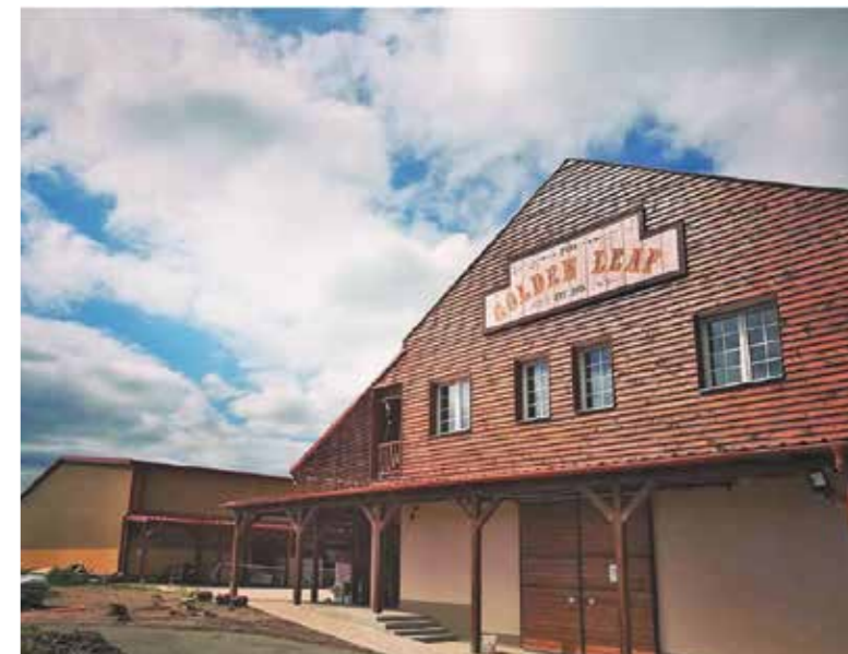
Az új lovas versenyközpont Kerepes Szálaska nevű részén

Az első western kurzust 2017-ben tartották, majd 2018-tól kapcsolódtak be a western szakág életébe. Idén a július 17-ei hétvégén lesz náluk zárt kapus western felkészítő verseny.