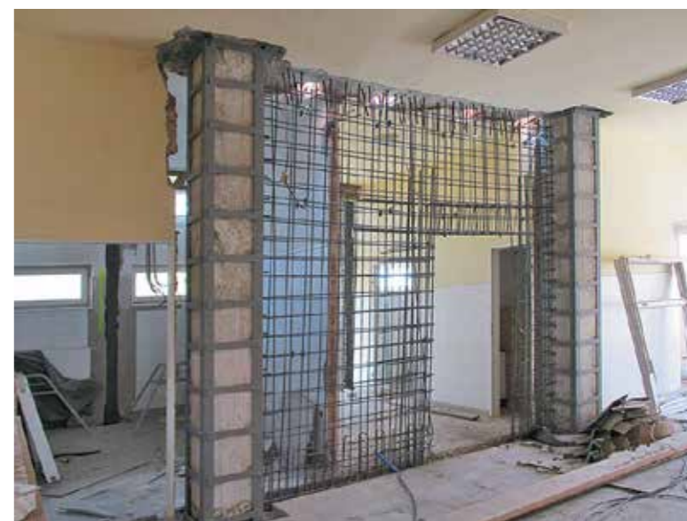
Vasalással gyámolított oszlopok és erős vasbeton szerkezetek tartják a földszintre épített két új emeletet

első verzió állami támogatása 1 milliárd 150 millió forint volt, de ez tartalmazott egészségügyi eszközfejlesztést is. Szatmáry Kristóf parlamenti képviselőnek sikerült további 273 millió forint támogatást szerezni, majd az állam idén júniusban adott további 120 millió forintot. Az állami támogatás teljes összege (a közel 75 milliós, már végrehajtott eszközfejlesztést leszámítva) 1 milliárd 542 millió 401 ezer 175 forintot tesz ki, a bővítés teljes költsége 2 milliárd 68 millió 416 ezer 929 forintot tesz ki – a két összeg különbségét az önkormányzat saját forrásból fedezi.