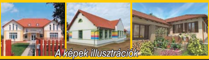
A képek illusztrációk