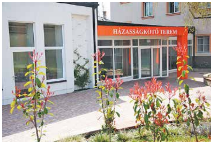
A Kertvárosi házasságkötő terem előtti parkot a hivatal épületének tetejéről összegyűjtött, és hatalmas föld alatti tartályokban tárolt esővízzel öntözik

A csapadékcsatornák eddig megvalósult rendszerének kiépítése hatalmas munkát jelentett. A Csömöri úti csapadékcsatorna az útfelújítással egyidőben, több szakaszban készült el, és a Rákospatakba juttatja a mélyebb területekre áramló esővizet. Emlékeztető beruházás volt, mire a Margit utcából több kacskaringón át sikerült eljutni a Cziráki utcán át az Egyenes utcai lakótelephez, ahonnan még a 70-