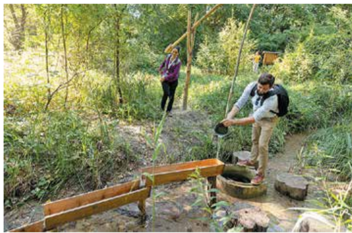
Nemzetközi szakemberek is elismerik a nemrég megvalósult csömöri patakrehabilitációs projektet