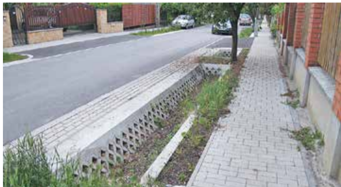
Egyre több helyen látni ilyen árkokat, amelyek nem elvezetik, hanem helyben tartják és elszikkasztják az esővizet

es években építettek meg egy csatornaszakaszt a Rákospatakig.