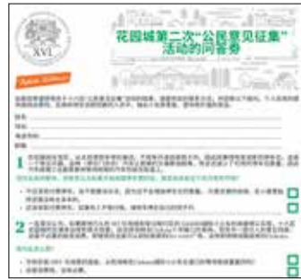
A Kertvárosi konzultáció kérdőíve kínaiul (részlet)

A Szakrendelő a Kertvárosban önkormányzati kézben van, és az államosítási törekvésekkel szemben ezt eddig sikerült megvédeni. Most a lakosságot kérdezik meg arról, jó gazdája-e a szakrendelőnek az önkormányzat. A következő kérdés a menzamenüre vonatkozik – mint a polgármester elmondta, ennek jelentős előzménye van. A kerületi iskolások szüleiből alakult egy szervezet, amelyik kapcsolatot tart az önkormányzattal és a közétkeztetést végző Prizma Juniorral. A szülői szervezet több újítást is javasolt, hogy kelendőbb legyen a menzakaija. Ezek egyike volt,